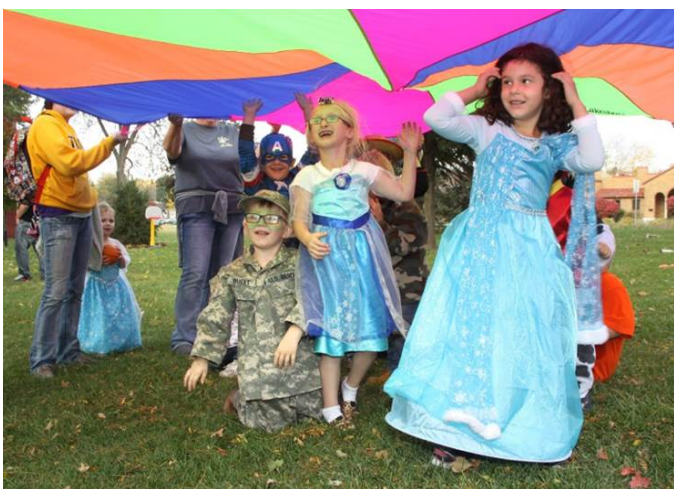
Festival de Otoño del 2014

La visión de New Opportunities Inc. Head Start/Early Head Start es que todos niños y familias tengan un ambiente seguro, saludable y propicio para vivir, aprender y crecer.