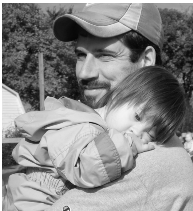
Viaje al Huerto de Deal del 2014